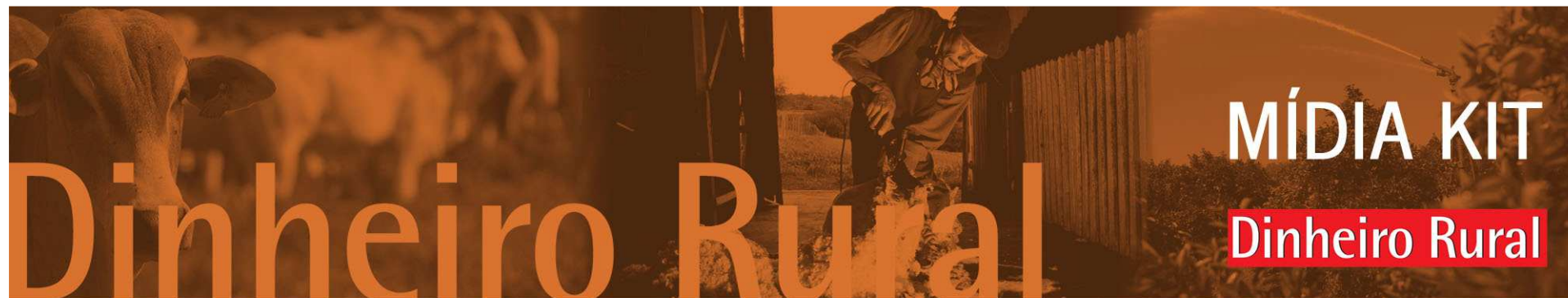
Tabela de preços – abril/2012 a março/2013